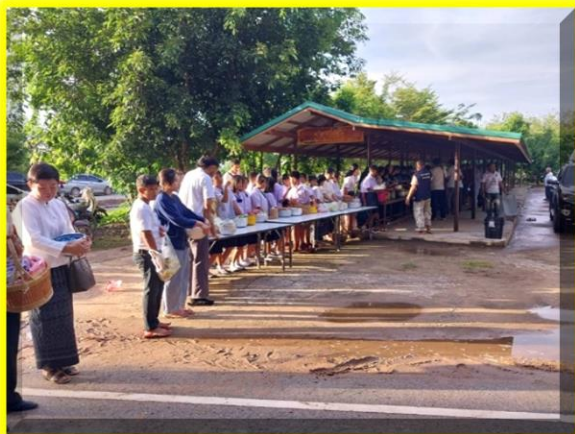
ชาวบ้านและเด็กนักเรียนร่วมกันเข้าแถวตักบาตร