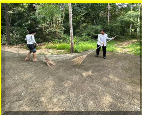
พนักงานและนักเรียนเริ่มทำความสะอาดบริเวณรอบๆวัดและศาลาวัด