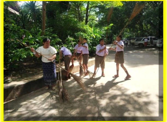
เด็กๆ สู้ๆกวาดๆ