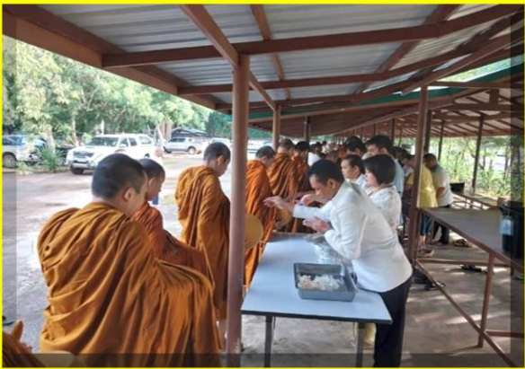
ท่านนายอำเภอและภริยาตักบาตรตอนเช้า