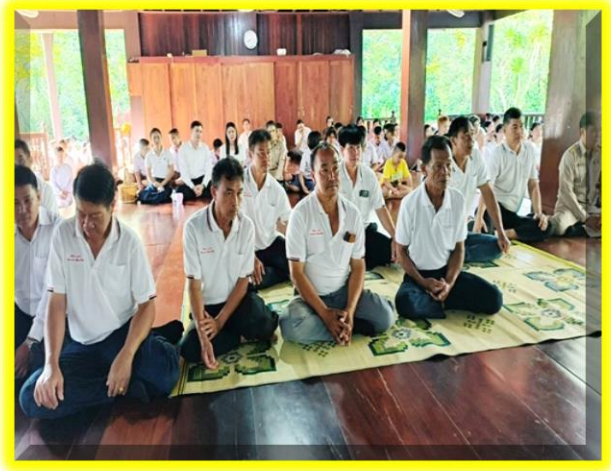
คณะผู้นำชุมชนเข้าร่วมรับศีลรับพร