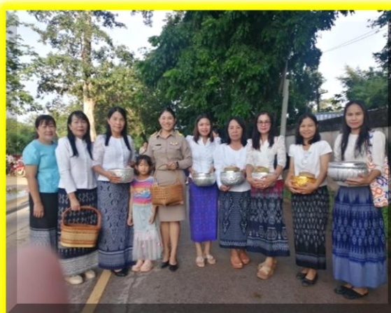
คณะครูศพด.ตำบลเมืองพาน