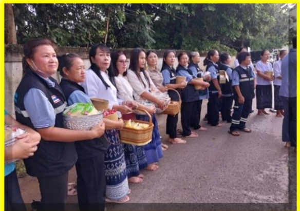
คณะ อสม ตำบลเมืองพาน