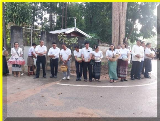
คณะท่านสมาชิก อบต.ทั้ง ๑๖ หมู่