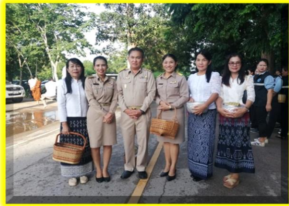
พระคุณครูและท่าน ผอ.โรงเรียน