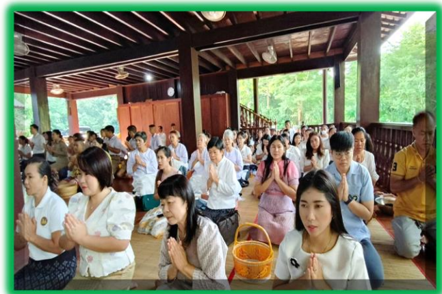
ให้วพระรับศีล พนักงานเริ่มทำความสะอาดบริเวณรอบๆ วัด