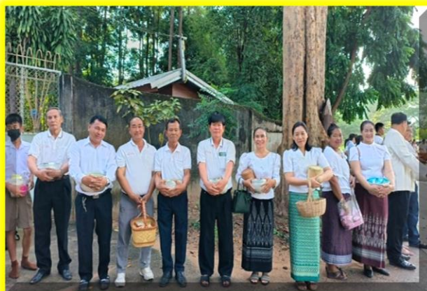
คณะท่านสมาชิก อบต.ทั้ง ๑๖ หมู่