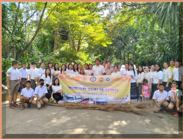
// ขอขอบคุณทุกท่านที่ได้เข้าร่วมโครงการ วัดประชา รัฐ สู่การพัฒนาวัดอย่างยั่งยืน วันที่ ๒๕ กันยายน ๒๕๖๖ ทั้งภาครัฐ และภาคเอกชนและร่วมทำกิจกรรมจิตอาสาร่วมใจพัฒนาท้องถิ่น พัฒนาชุมชนต่อไป //