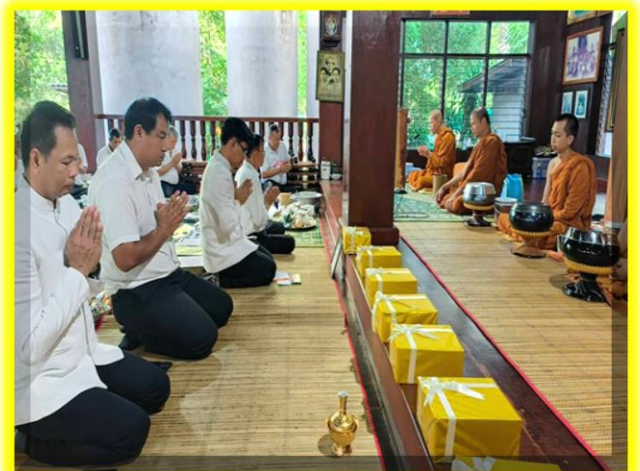
และท่านนายนอำเภอ นายก.อบต.เมืองพานถวายภัตตรหาร