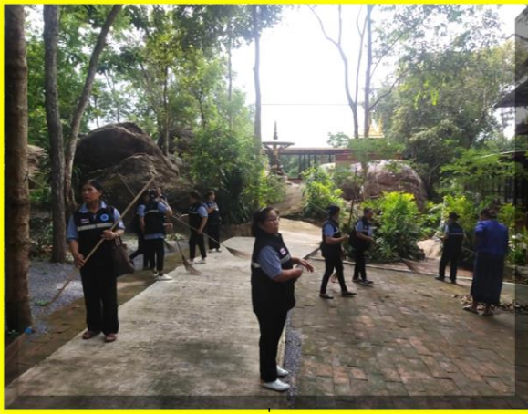
คณะ อสม.เริ่มทำความสะอาดบริเวณวัด