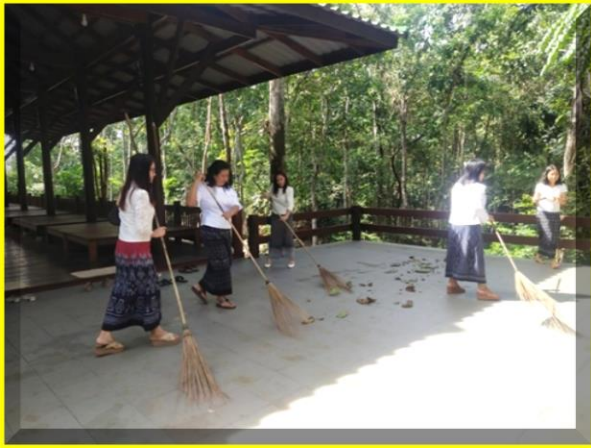
พนักงานเริ่มทำความสะอาดบริเวณรอบๆวัดและศาลาวัด