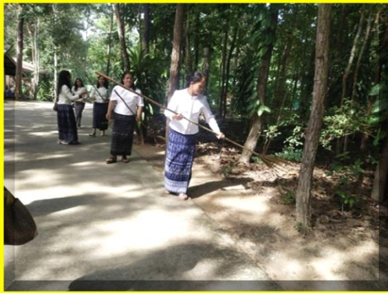
พนักงานและนักเรียนเริ่มทำความสะอาดบริเวณรอบๆวัดและศาลาวัด