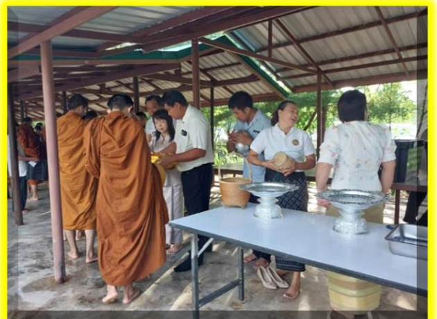
ท่านนายกและคุณแม่ตักบาตรตอนเช้า