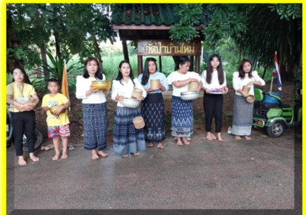
คณะคุณครู ศพด.เข้าร่วมทำบุญตักบาตร