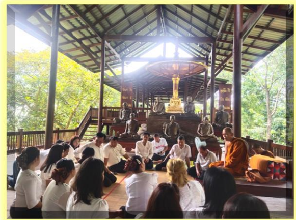
คณะผู้บริหารและพนักงานทุกท่านเข้ารับศีลรับพรจากพระอาจารย์